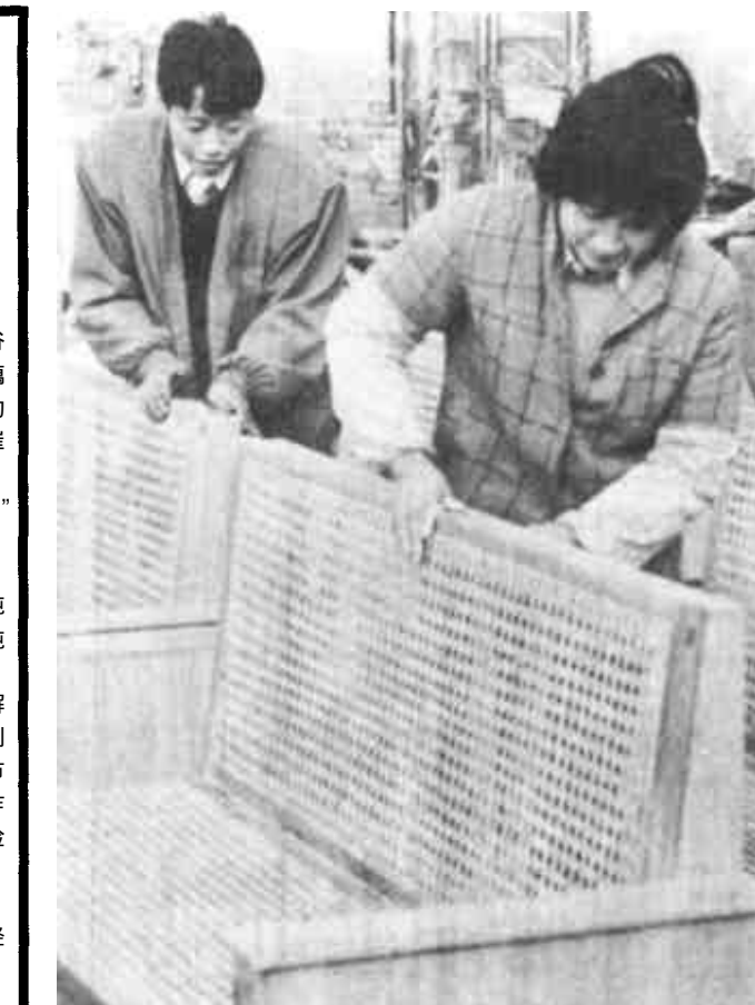
△ 利津县陈庄木器厂坚持以市场为导向开发新产品，目前前已开发出聚酯、古典雕刻等4个系列60余个品种，产品已在本省及江苏等地打开销路。

来，愿意跟他入股搞开发，最后入股达到200户。之后，他们以每亩每年上交50.4元承包了2200亩荒碱地。他们成立了股份合作制理事会，选出了5名理事，制定了章程制度，实行民主管理制度，并对承包的荒碱地进行了详细规划。说干就干，200个股东，200个劳力，开进荒碱地，仅一个多月，上万吨的沟渠挖通了，800亩稻田地整平了，藕田、苇田也都拿起了大槌。 此举给人带来几点启示：启示之一，股份合作制解决了一家一户办不了、办不好的事，一股一个劳力就形成了“大集团”作战。由于股份合作制制家有家，利益共享，人人都把开发当作自己的事干，一个顶一个、个个出大力。克服了人多地大、资金不足也是制约农民发展生产的一大难题。但实行股份合作制这就不难了，股东集资“众人拾柴火焰高”。大伙一凑，上万元的生产资金解决了。生产中出现难题，股东们齐拿主意想办法。去春黄河断流，他们仅用一天就借来大小抽水机10多台，两级提水保住了稻田和藕田用水。稻田发生虫害，几十架喷雾器一齐打，二三天就治住了虫。 启示之二，股份合作制将大家的心聚在一起，劲使到一块，难题好解决，困难好战胜，夺取丰收有保证。收获的季节，崔玉光等200户入股农民开发的荒碱地喜获丰收。种植