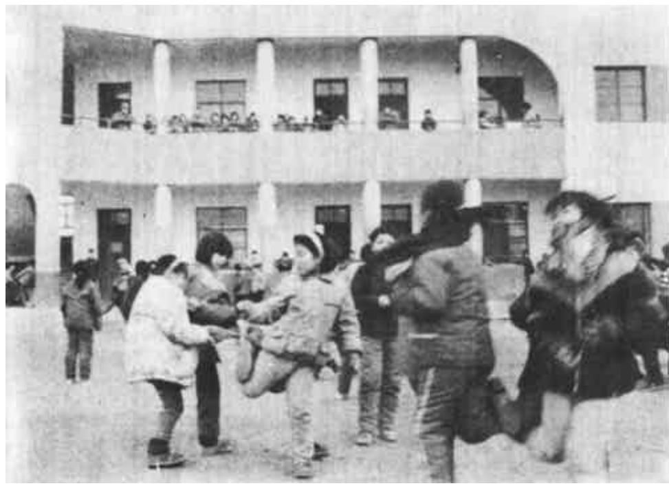
东营区胜利镇王营村十分重视抓好教育工作，自筹资金30万元建起一所高标准的小学。不仅解决了本村学龄儿童上学问题，还为一些邻村儿童上学提供了方便。

的农田种植结构。放开粮食价格，大大提高了农业生产人员的积极性，他们积极发展农副产品深加工，变资源优势为产品优势，使一大批农业生产单位当年实现了扭亏为盈。各单位从实际出发，制订了一系列与承包经营配套的管理措施。一些中等实力的企业人轰动效应。各级多种经营企业采用外引和内联、合资和合作相结合的办法，内联打基础、外引上水平，在集团化、规模化经营方面迈出了重要步伐。开拓经营有出路，走向市场天地宽。一年来，全局多种经营蓬勃发展，农工商各条战线结出累累硕果。无论在数量上还是在质量上都比上年有所提高，基本上满足了职工家属的生活需求。工业企业效益明显，第三产业蓬勃兴旺。不包括二级单位，全年共兴建、扩建和配套完善各类商饮服务网点21个，旅游娱乐设施网点5个，安置富余人员和待业青年1.2万人。（李钧 张晓华）