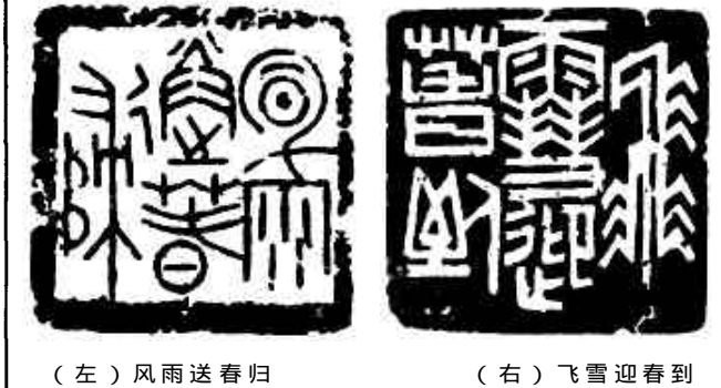
(左) 风雨送春归 (右) 飞雪迎春到 篆刻 / 毕顺先

谁都公平（外一首） 徐玉祥 时间就是金钱 都这么忙 上帝把时间公平的 送给每个人 有人把无价的时间 变为有价的时间 有人把无价的时间 仍做有价