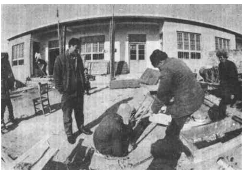
东营区发挥临海优势，在广利港处投资400多万元，修建了可容纳100多户渔民居住的渔民新村一期工程。图为渔民在新宅内修补渔船。

这家公司采用的科研新工艺生产规模，在省内属首家新产品项目。目前，这个公司的产品不但在国内市场供不应求，而且在国际市场走俏。（韩荣华 王金秀）